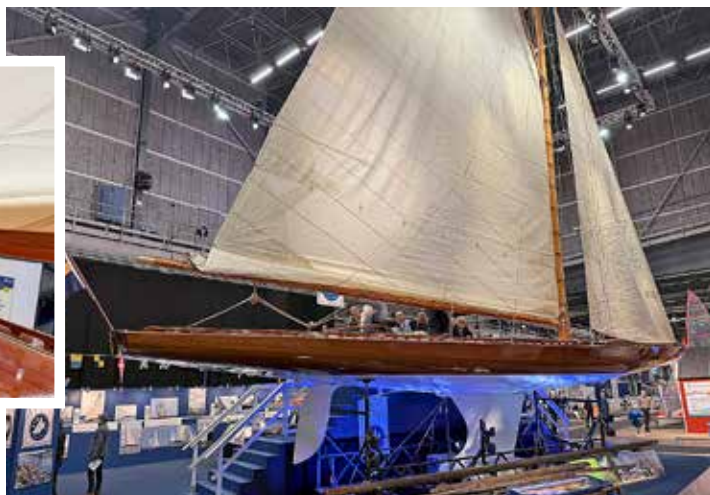
Kappseglingssjakten Ester visades i nyrenoverat skick.