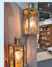
Antikmässan hölls parallellt första helgen.

Allt för sjön 2025 hölls 6–9 mars och 13–16 mars. Första helgen hölls även Antikmässan och under andra helgen kunde besökarna utforska Stockholm Husvagn Husbil. Sportfiskemässan hölls parallellt 14–16 mars. Totalt besöktes mässorna av 61 500 personer, varav Allt för sjön hade 36 000 unika besökare.