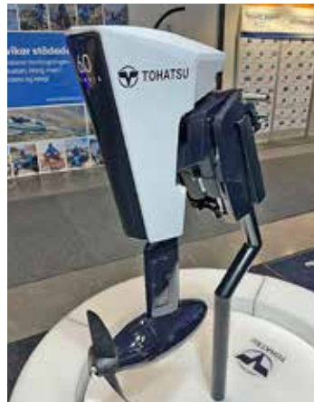
Tohatus elutombordare Alaris visades för första gången. Den är på 6,0 kW och har bland annat en borstlös DC-motor och inbyggd GPS.