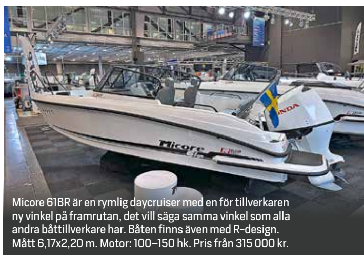
Micore 61BR är en rymlig daycruiser med en för tillverkaren ny vinkel på framrutan, det vill säga samma vinkel som alla andra båtillverkare har. Båten finns även med R-design. Mått 6,17x2,20 m. Motor: 100–150 hk. Pris från 315 000 kr.

Rupert R9 hade världspremiär i Göteborg. Båten har flexibla däckslösningar, stora stuvutrymmen och anpassningsbara sittplatser. Tuberna är i hypalon/neopren och båten är avsedd för dubbla motorer 2x200 eller 2x300 hk. Mått: 9,00x3,00 m. Toppfart upp till 60 knop. Marschfart från 40 knop.