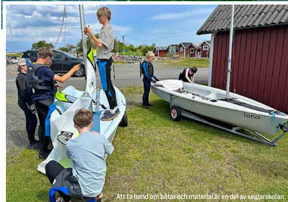
Att ta hand om båtar och material är en del av seglarskolan.