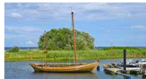
Vrakekan är byggd som en replika av en gammal eka. Vrakekor användes bland annat vid sillfiske.