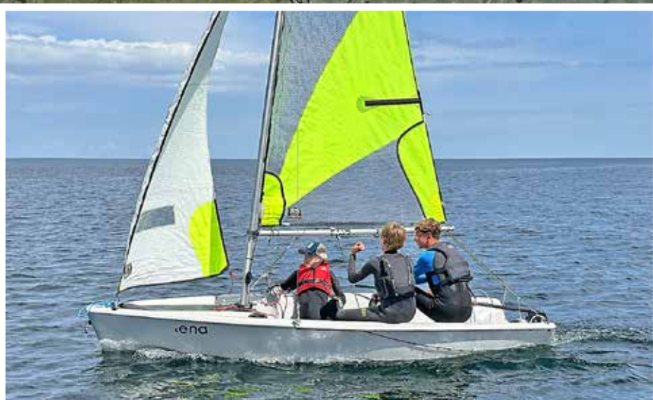
Loja vindar när ungdomarna seglar en Feva på Hanöbukts kalla vatten.

KIVIK ÄR KÄNT för sitt anrika fiske- läge, sina fina stränder och de många äppelodlingarna. Denna pit- toreska del av Österlen invid Hanöbukten är också platsen där Fritiof Nilsson Piraten står starkt och författaren Björn Ranelid bor vid en vacker äppelodling.