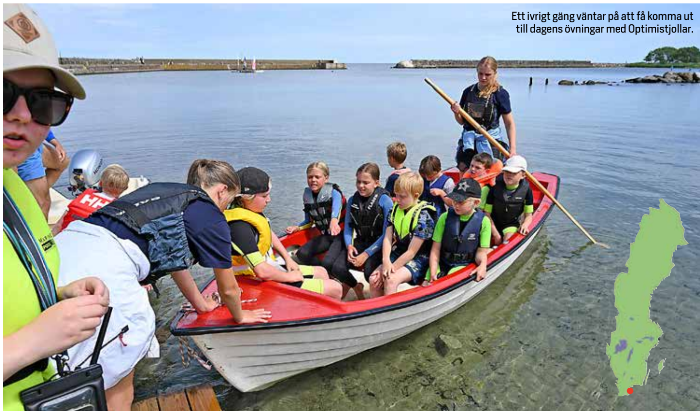
Ett ivrigt gäng väntar på att få komma ut till dagens övningar med Optimistjollar.