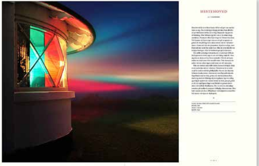
De nästan 300 fotografierna i Magnus Rietz konstnärliga och mycket vackra bilder av fyrar. Inte minst hans fantastiska bok "Fyrar runt Östersjön" (bilden ovan) boken är en storslagen hyllning till fyrars skönhet, både utvändigt och invändigt, och till miljöerna där de finns. Bilderna är oftast tagna i befintligt ljus. Kvaliteten är i absolut toppklass.

FYRAR BJUDER PÅ något alldeles särskilt för alla som gillar båtar och livet vid havet. De ligger ofta på avlägsna eller utsatta platser och varje fyr har av olika skäl sin speciella karaktär.