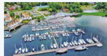
Bilden visar hamnen fotograferad från norr, centralt belägen med en allmän badstrand till höger.

Friluftsrådet gav besökarna chans att prova på att paddla kanot.