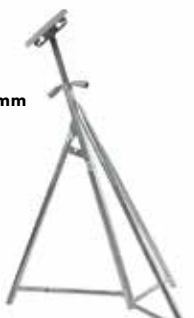
MBS Motorbåtsstötta Top 310x160 mm SBS Segelbåtsstötta Top 255x255 mm