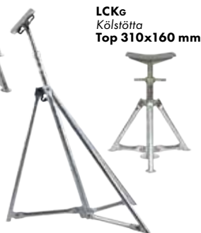
LCKg Kölstötta Top 310x160 mm