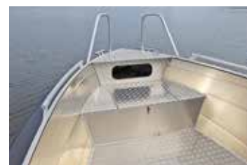
Bra insteg med höga räcken och en stor durkyta i den främre delen av båten.