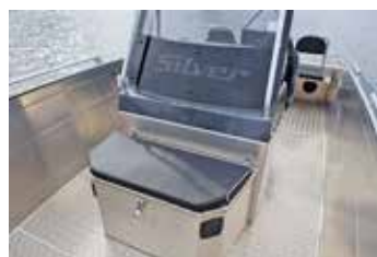
Under det främre sätet finns ett djupt fack där man får in båtens dynor och mycket annat.