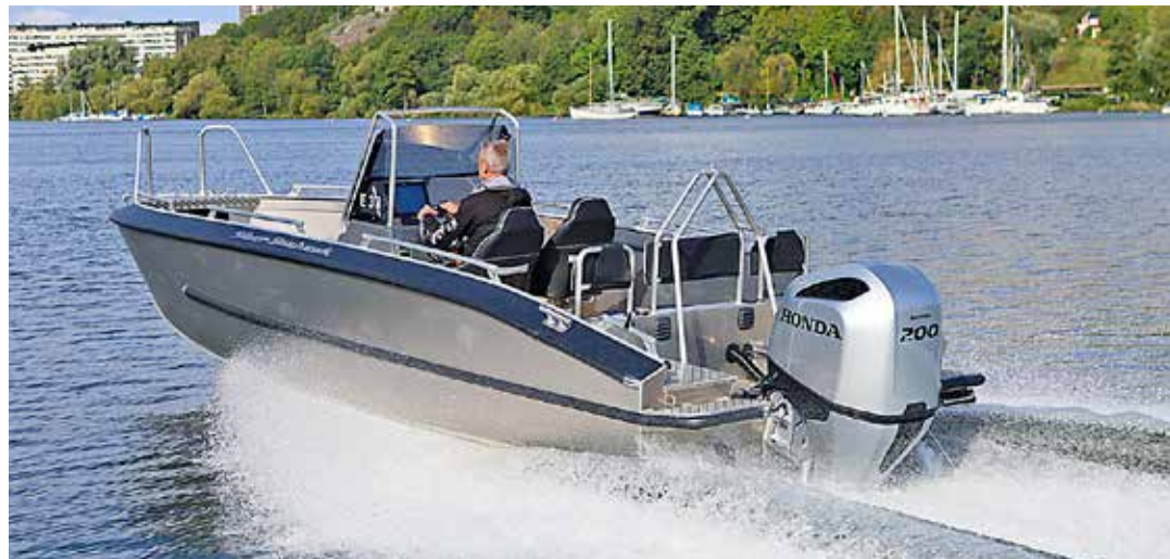
Vi har provkört den öppna styrpulpetbåten CCX med en 200-hästars Honda.