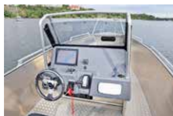
Båten har en bred styrpulp tillverkad i glasfiber. Smart utformad och gott om plats för extrainstrument.