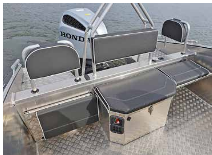
På var sida om det akre stuvfacket har man monterat in fällbara säten. Notera även vridbara ryggstöd som gör det enklare att komma ut till badplattformarna.

Denna stora styrpulpbåt känns mäktig i sjön ända upp till toppfarten. Bra tyngd som ger en lugn gång och höga fribord som gör att man känner sig trygg inne i båten. ☺