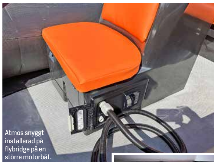
Atmos snyggt installerad på flybridge på en större motorbåt.

Atmos drivs med 12 Volt och med några knapptryckningar ställer man