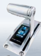
Flexball reglage från 23 000 kr.