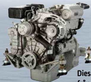
Dieselmotor från 43 700 kr.