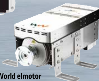
WaterWorld elmotor från 52 000 kr.