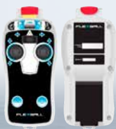
Docking remote från 43 000 kr.

VI HAR DET MESTA NÄR DET GÄLLER TEKNISK UTRUSTNING TILL DIN BÅT!