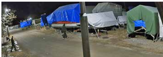
Lidingö Segelsällskap kunde följa ett inbrott i realtid via kameror på båtklubben. På bilden syns två personer i färd med att stjäla.

Klubben kände sig trygg och säker med den installerade kameraövervakningssystemet och hoppades att de inte skulle ha något egentligt behov av kameraövervakningen. Men verkligheten visade sig senare vara