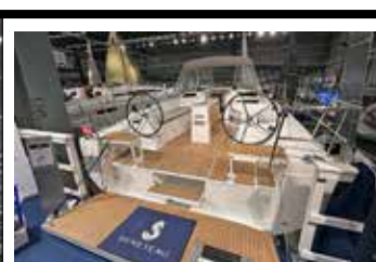
Generös sittbrunn i Beneteau 37.1. båten är på 11,93 m (l ö a) längd och 3,92 m bred.