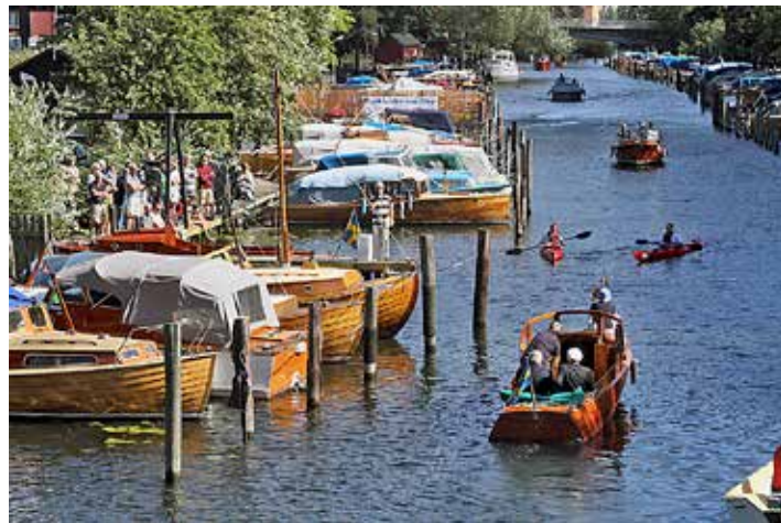
Båtklubbarnas Dag 2016 vid Heleneborgs Båtklubb.