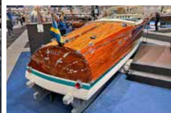
Riva Ariston "Gibile" drog många trånande blickar till sig. Den vackra båten mäter 6,47x2,16 m och är byggd 1960. Båten är byggd i kallbakad kryssfaner i mahogny och har en Chrysler 318 M-80 motor.