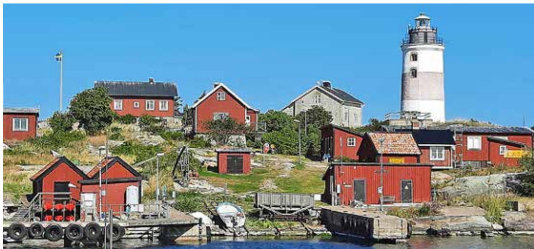
Söderarm fyrplats i Stockholms norra skärgård på gränsen till Ålands Hav är väl värd ett besök.

– Det är inte mer blåsigt här än på andra ställen och man kan gå inomskärs hela vägen ut. Det finns en hel del grynnor, men ännu mer