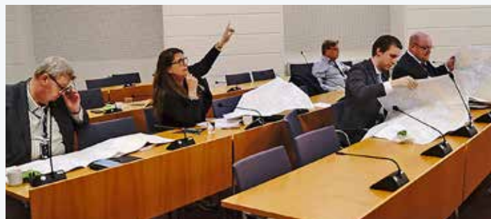
Navigationutbildning i riksdagen.

fem kvällar och avslutas med en båtpraktik i samband med riksdagens Båtlivsutflykt, som sker i mitten av juni.