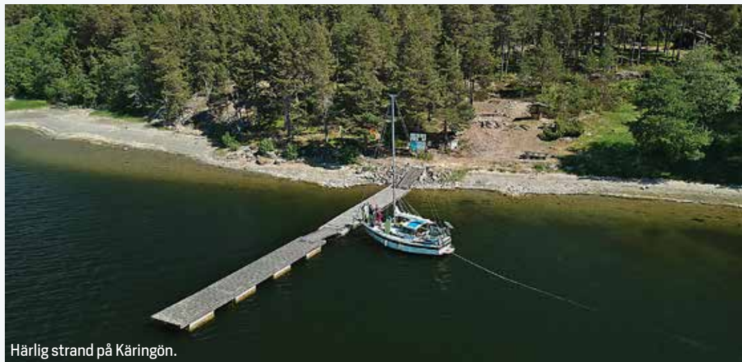
Härlig strand på Käringön.