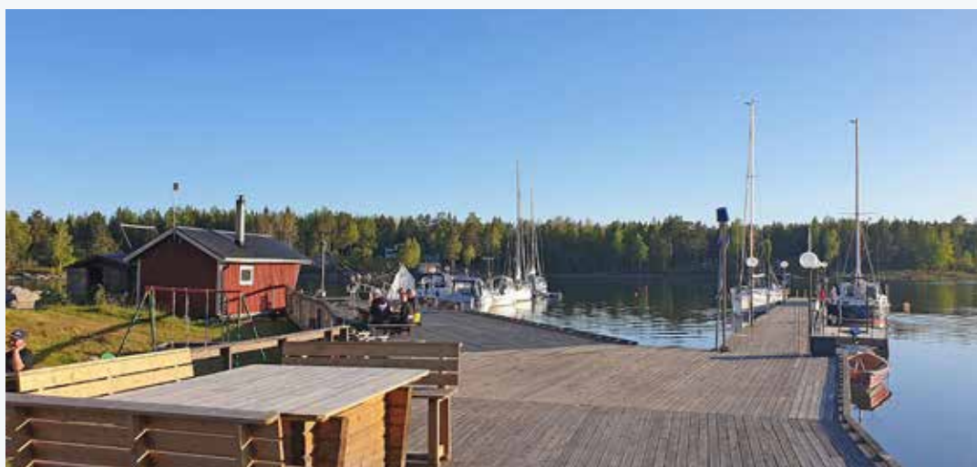
Hälsingekusten är en riktig guldgruva där alla båtfarare är välkomna.