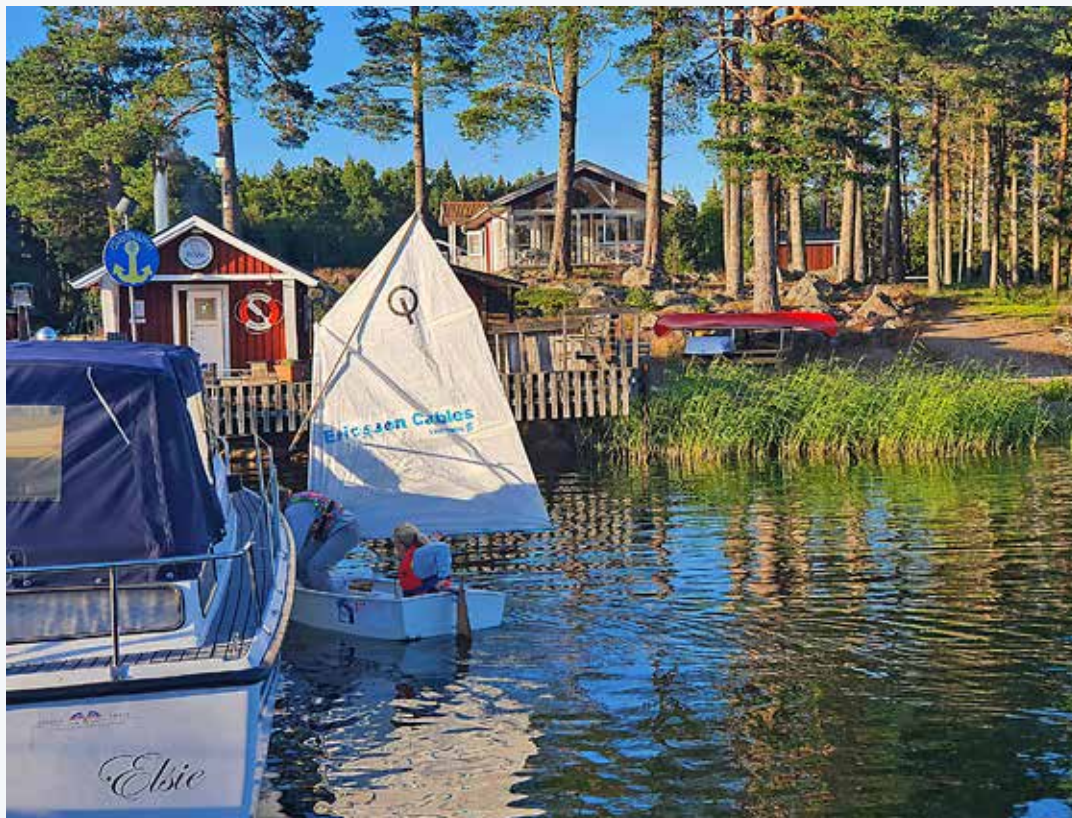
HSSS är en aktiv klubb med sina 18 båtar som ungdomarna förfogar över.