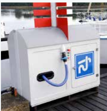
Toalettömningsanläggning hos Pukaviks Båtklubb.

SBU har påbörjat arbetet med att ta fram informationsmaterial om det nya regelverket och dess konsekvenser. Mer information finns på SBU:s hemsida och kommer att presenteras via nyhetsbrev och webinarier efter sommaren. Scanna qr-koden nedan för mer information.