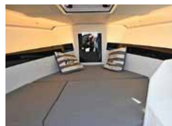
Två personer får var sin fullängds-koj på 2 m och dessutom kan ett barn sova på en iläggsskiva med madrass.

AMT:S FÖRSTA generation daycruisers – 200 DC och 230 DC – introducerades 2006 respektive 2012. Båtarna hade redan då väl tilltagna sittbrunnar, en trend som därefter har vuxit sig stark. Nya 240 DC baseras på föregångaren 230 DC, men här har tillverkaren tagit ett steg till. På 7,3 m har de fått plats med en sittbrunn med sittplats för åtta vuxna runt matbordet, en förkabin med två fullängdskojer plus en iläggsskiva för barn och en väl genomtänkt förarplats. I förkabinen finns även en vattentoalett.