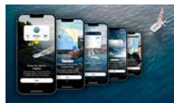
Skippo har ett nytt utseende och nya funktioner för att underlätta användandet.

– Vi har även jobbat med viss typ av ny visning av vind och väder direkt