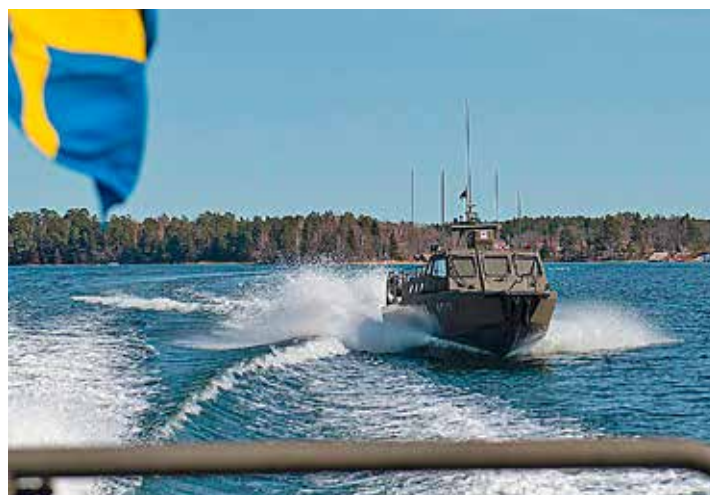
Roslagens Sjövärnskår övar.

I informationen om den stulna båten nämns att den tidigare tillhört Försvarsmakten och på nära håll ser Sjövärnskares besättning flera detaljer som förkommer på försvarets båtar av samma typ.