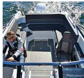
Sittbrunnen i AMT 240 DC är kanske den största i sin klass.