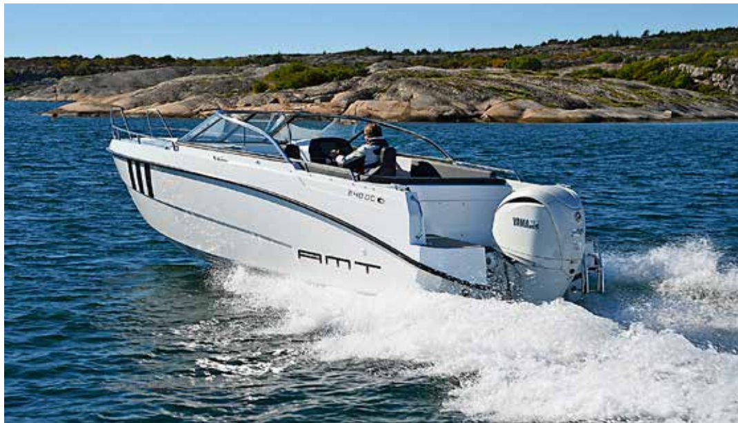
AMT 240 DC är AMT:s nya flaggskepp. Båten är godkänd för nio personer och stora sociala utrymmen.

En daycruiser med en rejäl sittbrunn är det nya flaggskeppet från finländska AMT. Båten har bra standardutrustning och rejäla prestanda. Text & foto: Lars-Åke Redéen