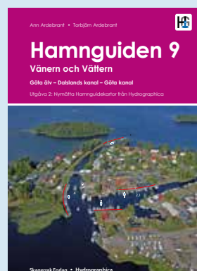
Vänern och Vättern - Göta älv Dalslands kanal - Göta kanal