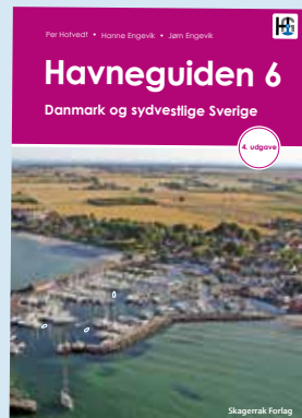
Danmark och SV Sverige