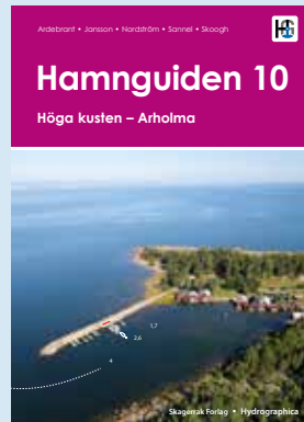
Höga kusten - Arholma