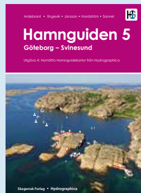
Svinesund - Göteborg