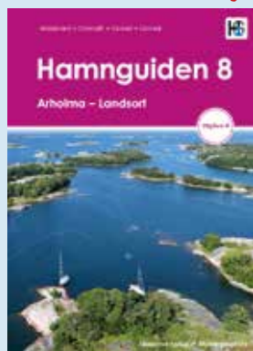
Arholma - Landsort