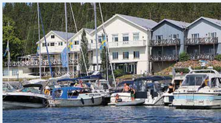
Ulvö hotell lockar gäster från hela den svenska kusten.