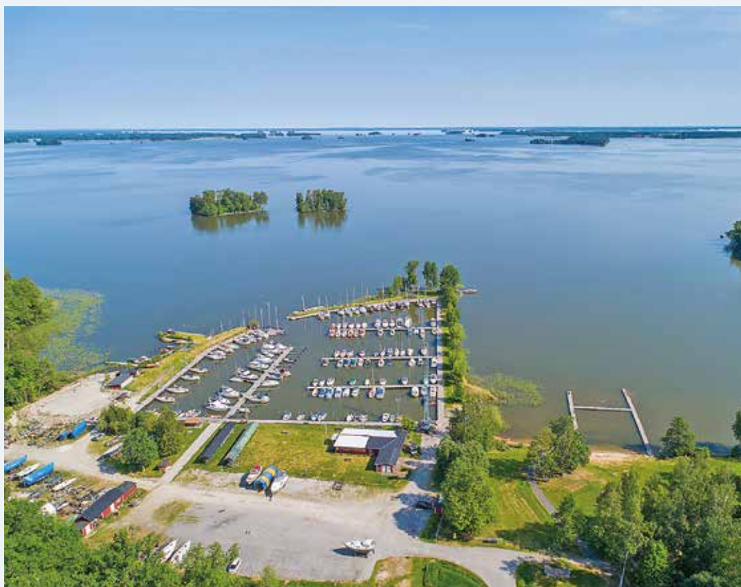
Hjälmarens är Sveriges fjärde största sjö med fem kommuner runt om sig.

tan två mil bred. Eftersom det är en kommunal sjö tar staten inte något ansvar, varken för utprickning, avlyssning av VHF, kanal 16, eller för muddring och liknande.