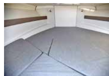
Elegant sittbrunn med sköna dynor och ryggstöd. Enkelt, men snyggt utformat sovutrymme med belysning. Två personer får plats om man lägger sig lite på snedden i T6:an.