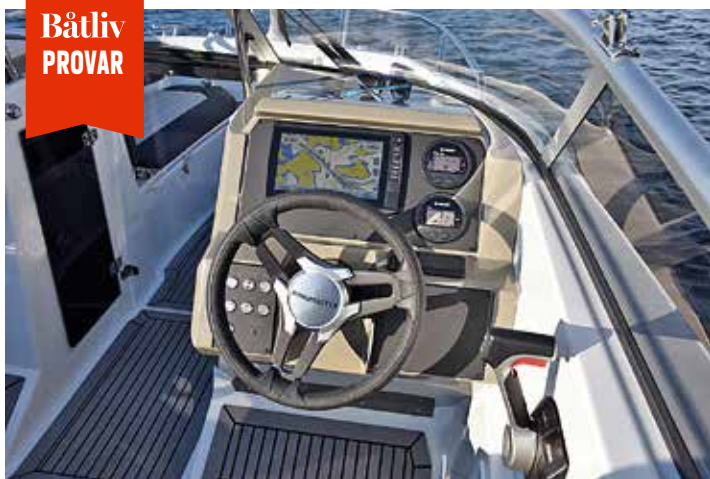
Elegant förarplats i fina färger i R6:an som inte ger solreflexer. Kartplotter och separata motorinstrument är standard.