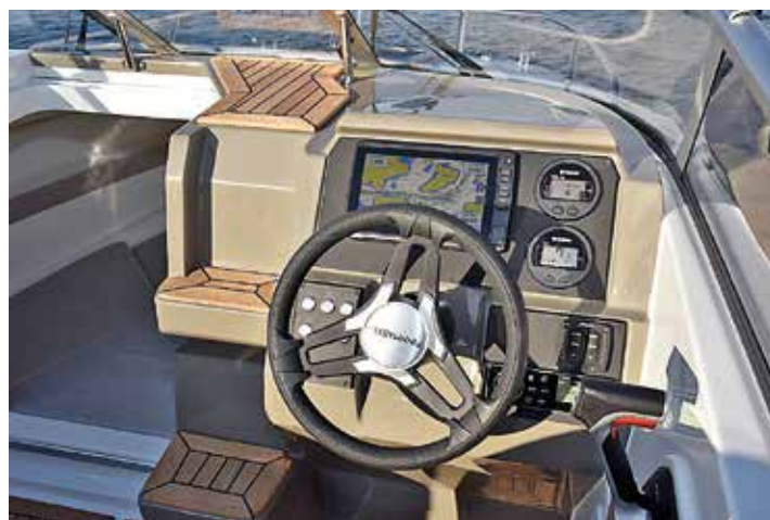
Förarplatsen i Finnmaster T6 är lika bekväm och välutrustad som den i R6:an. Kartplottern Garmin 92 cv är standard.