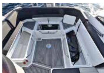
Även i den aktre sittbrunnen finns stora stuvfack. Som standard är Finnmaster R6 utrustad med ett grått durkmaterial i plast. Bra passage genom hela båten från för till akter.