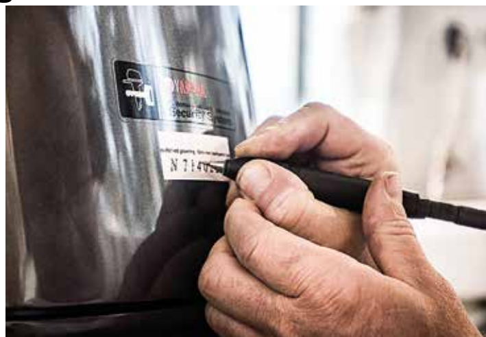
Yamaha ska stöldskyddsmärka alla utombordare från 30 hk och uppåt.