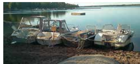
En slaktplats i Roslagen..