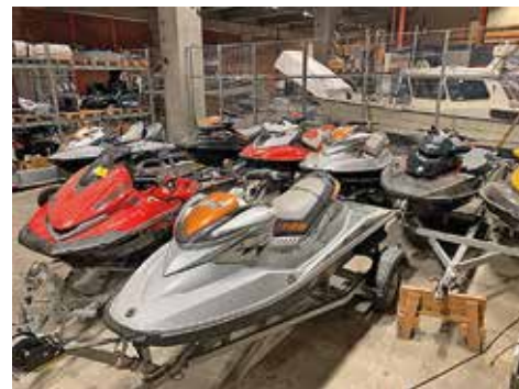
Vattenskotrar i sjöpolisens lager med stulet gods.