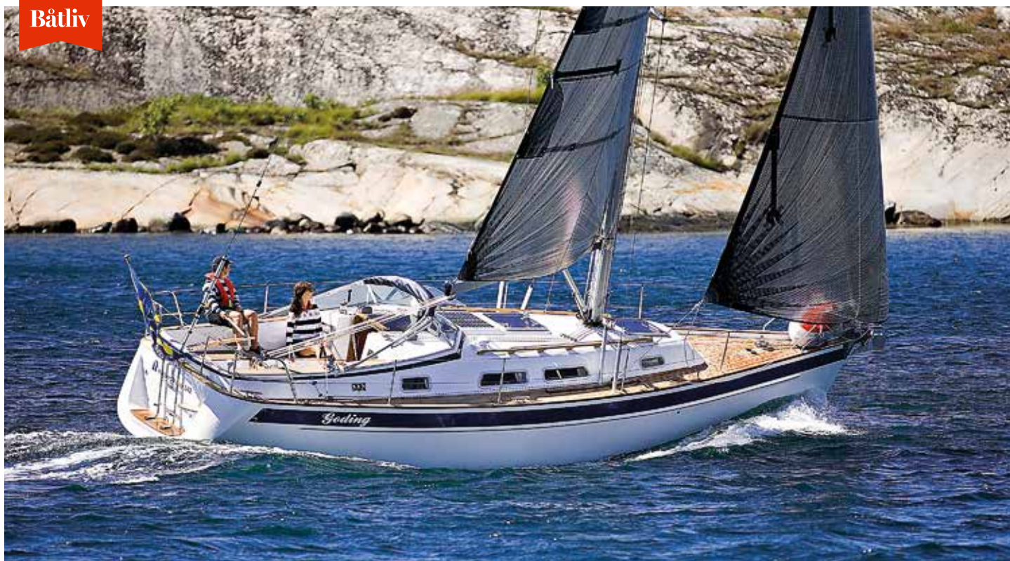
Hallberg-Rassy 342 tillverkades i mycket stora volymer.