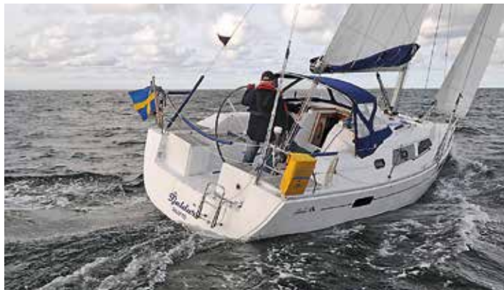
Hanse är ett populärt märke på begåtsmarknaden. På bilden en Hanse 320.

Att en 45-fotare inte ökar mer beror nog på att kostnaden för att ta hand om den på vintern ökar dramatiskt. En 40-fotare är möjlig att ha på en välorganiserad båtklubb för några tusenlappar, men en 45:a kring 15 ton måste