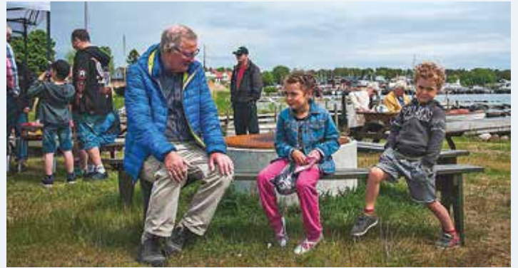
Hamnens Dag hålls 18 maj i Hällevik.