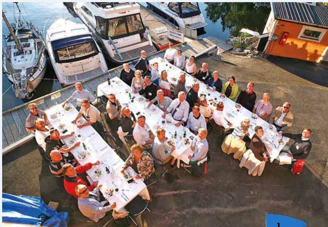
Träffar med riksdagens fritidsbåtnätverk är en av de påverkansmöjligheter som SBU använder sig av.

Ett exempel på sådant inflytande är ett hot inom EU om