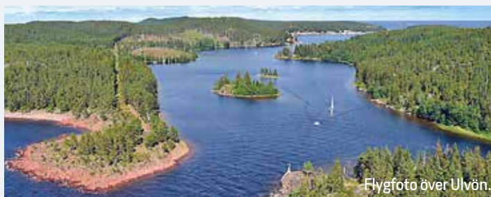
Flygfoto över Ulvön.