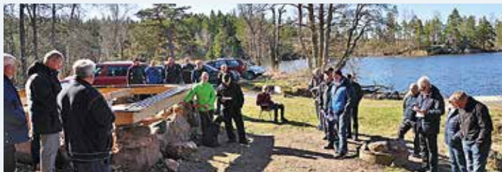
Odenbergsvikens BK:s årsmöte 2018 där delar av styrelsen och valnämnden informerade om förbundets verksamhet.

Alla aktiviteter som förbundet arrangerar för medlemmen är utan extra kostnad. Nu arbetar förbundet för att få en hjärtstartare