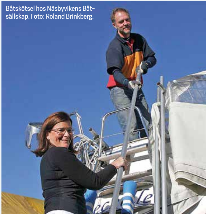
Båtskötsel hos Näsbyvikens Båtsällskap.

– Se till att få båtlivet lustfyllt för hela familjen. Fastna inte i kostnadsfällan och tro att det är dyrt. Båtlivet är fantastiskt prisvärt, säger Roger Alm (t.h.).