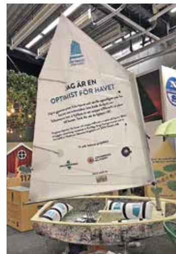
Optimistjollen Plastimisten från projektet Optimist för havet.