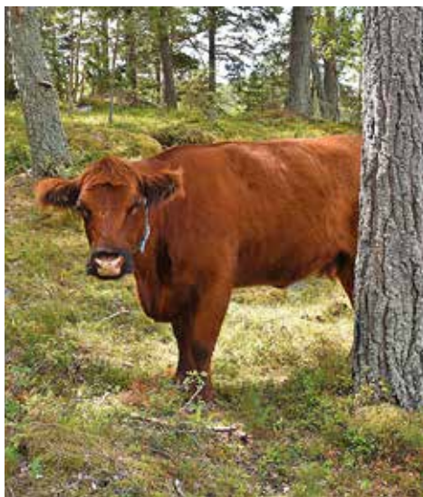
En av frivilligarbetarna i skogen.