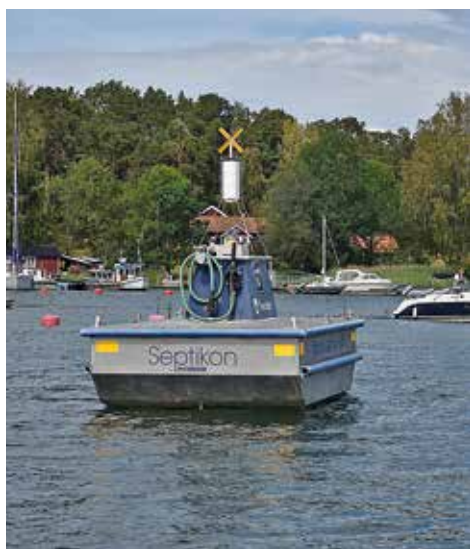
Flytande toatömningsstation utanför gästhamnen.