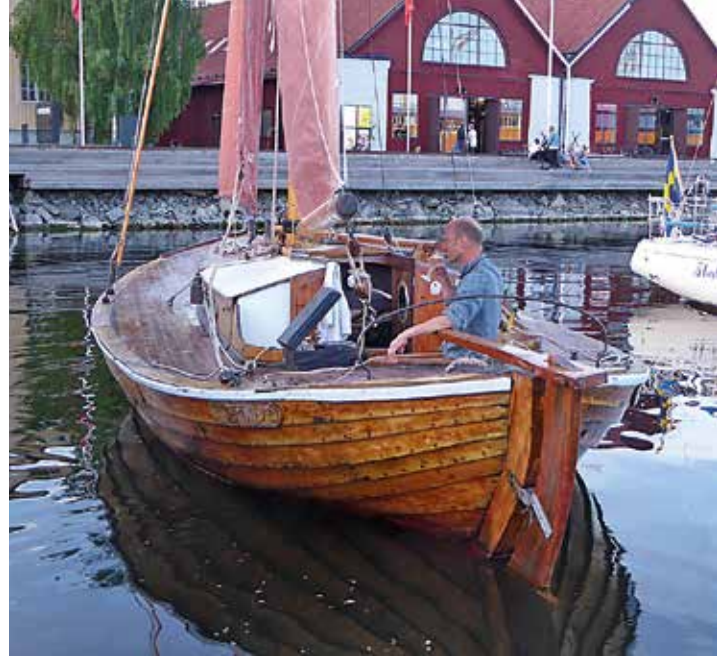
Kostern Gerdny går in i Vasahamnen.