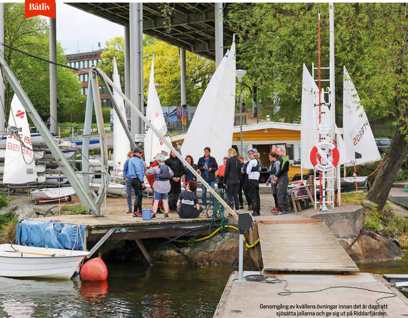
Genomgång av kvällens övningar innan det är dags att sjösätta jollarna och ge sig ut på Ridarfjärden.