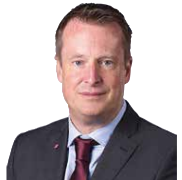
Inte intresserad. Inrikesminister Anders Ygemans (S) har inte svarat på Båtlivs frågor trots flera E-mail och sökningar per telefon.

En märkningssats från Securmark till en utombordare kostar 1 490 kr monterad och klar. Polisen, tullen, kustbevakningen, Larmtjänst och alla försäkringsbolag har tillgång till Securmarks register dygnet runt vid en stöld. Det gäller även Norge och Finland. I Estland, Lettland, Litauen, Polen, Tyskland, Holland, Belgien och Danmark har polisen och gränspolisens till registret och använder det.