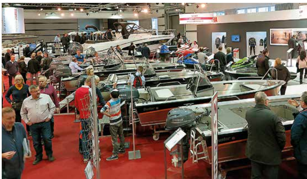
Yamahas stora monter med massor av plast- och aluminiumbåtar lockade väldigt många familjer och ungdomar.