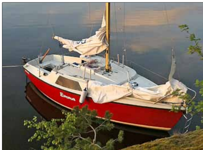
Emma i skyddad vik under seglatsen Stockholm-Kungsör i maj.

www.rollytasker.se 08 448 99 00 / 040 15 00 28